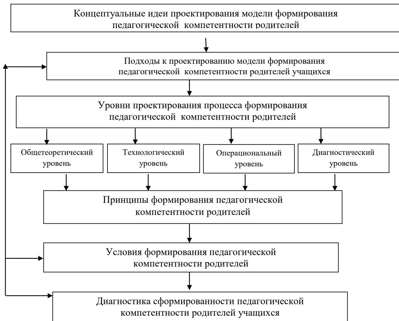
Рисунок 1 – Концептуальная модель процесса формирования педагогической компетентности родителей учащихся

Модель формирования педагогической компетентности родителей во взаимодействии субъектов образовательного процесса школы представлена на рисунке 2. Эту модель можно рассматривать как целостную структуру – организационную систему, предназначенную для анализа и проектирования содержания компетенций родителей. По мнению П.Р. Атутова, такая система «должна отвечать четырем критериям: обладать содержанием, структурой, связью и поддаваться управлению. Содержание системы – это звенья учебно-воспитательной работы МБОУ СОШ № 20. Механизм формирования педагогической компетентности предполагает постепенный переход от актуализации имеющихся знаний в области психолого-педагогического сопровождения развития личности младшего школьника к усвоению конкретно-методических знаний и умений, практического опыта деятельности и организации творческой деятельности родителей учащихся.