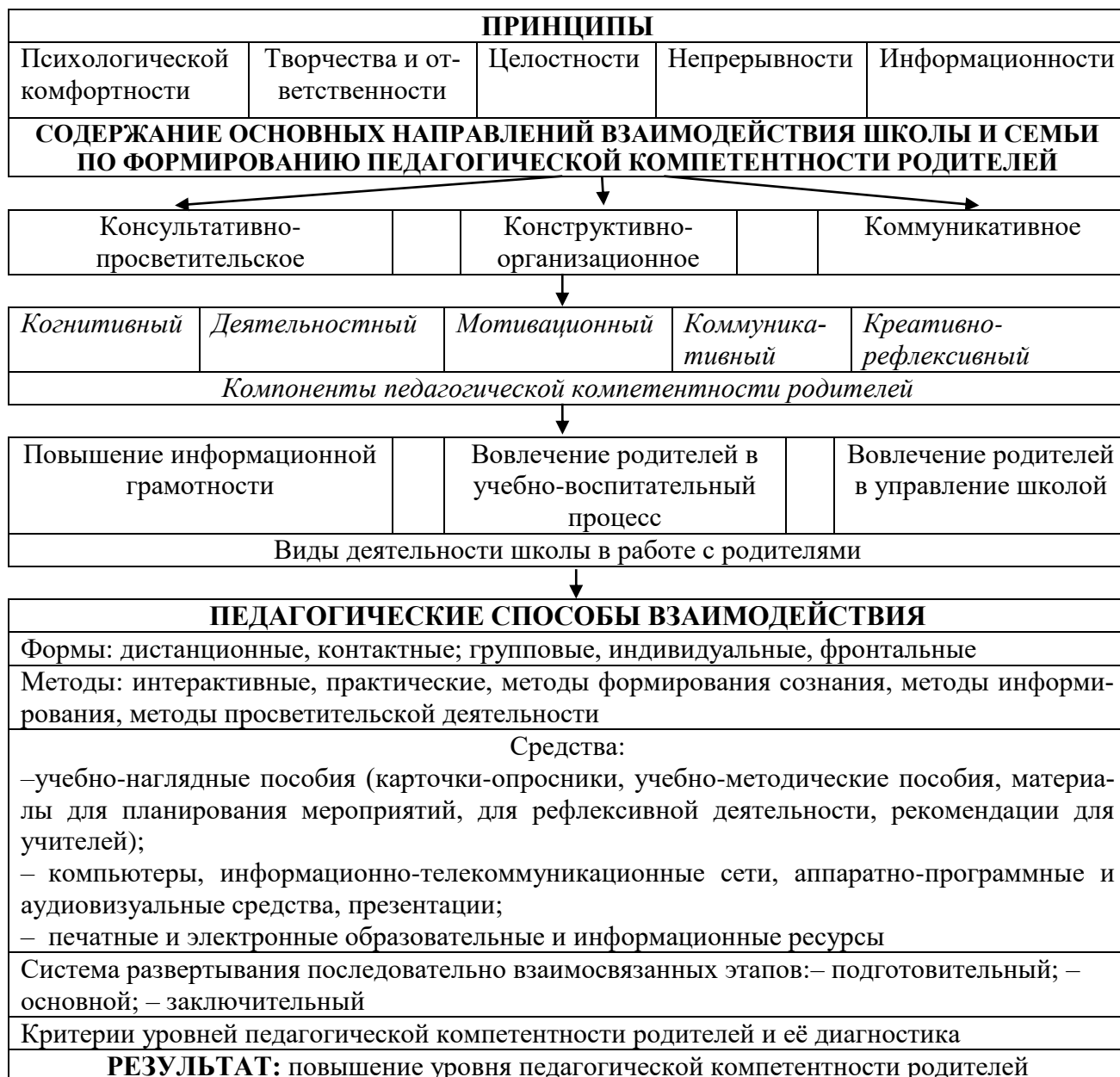
Рисунок 2 – Модель формирования педагогической компетентности родителей учащихся

Важной частью проекта явилось установление критериев, показателей и уровней сформированности педагогической компетентности родителей учащихся школы. Для этого разработана модель диагностики педагогической компетентности родителей учащихся школы (рисунок 3).