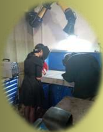
Организации и предприятия района