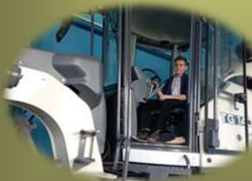
Организации общего, среднего специального и высшего образования