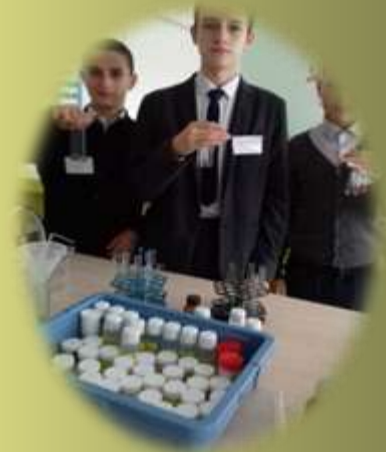
Образовательные центры «Точка роста»