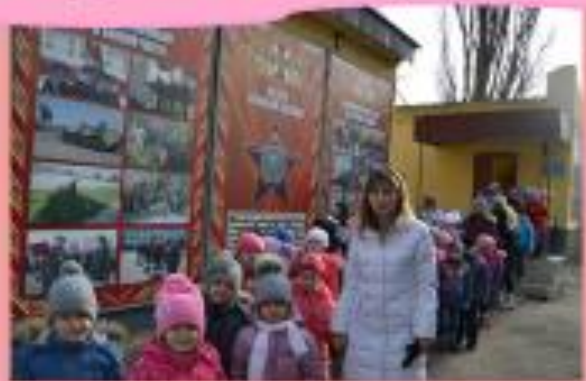
Экскурсии, целевые прогулки