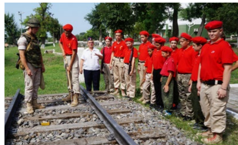
Рисунок 2. Занятие по боевой подготовке

Важная роль в юнармейском центре отведена объединению юных журналистов «Импульс», которые освещают