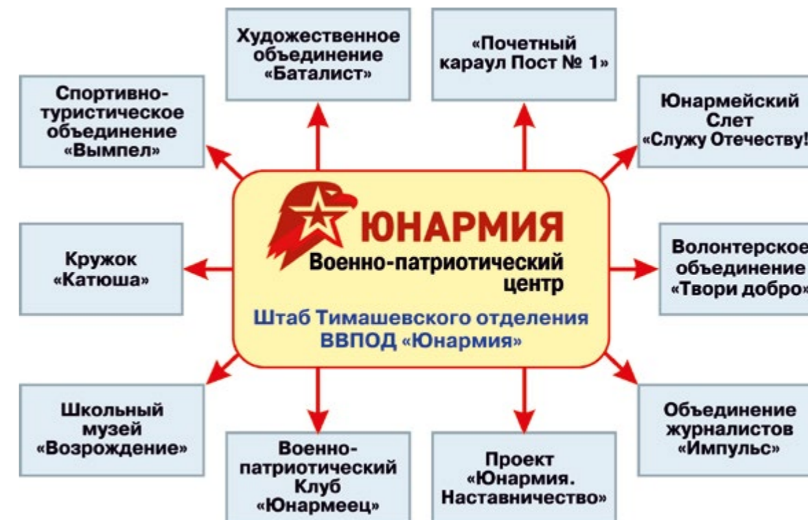
Рисунок 1. Модель военно-патриотического образования и воспитания ВППЦ «ЮНАРМИЯ» (Тимашевское отделение)

молодежью знаний и практического опыта в различных сферах деятельности: гражданско-патриотической, научно-технической, туристско-краеведческой, социальной, военно-спортивной и творческой, что позволяет комплексно решать зада-