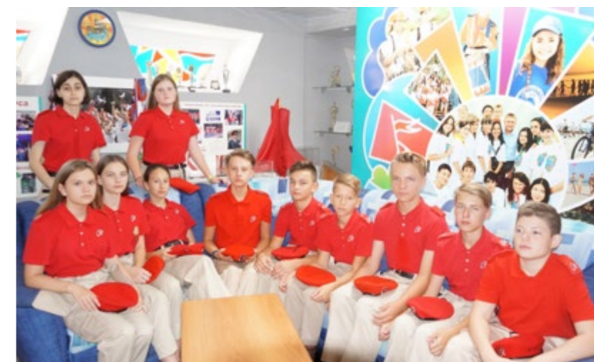
Рисунок 3. Тимашевские юнармейцы в музее ВДЦ «Орленок»

Внедрение в ВПЦ «ЮНАРМИЯ» программ дополнительного образования и эффективных технологий военно-патриотического образования позволило повысить качество знаний и добиться стопроцентной успеваемости среди юнармейцев. У них расширился кругозор, возросла социальная активность. Увеличилось количество участников Всероссийской олимпиады школьников, улучшились их результаты.