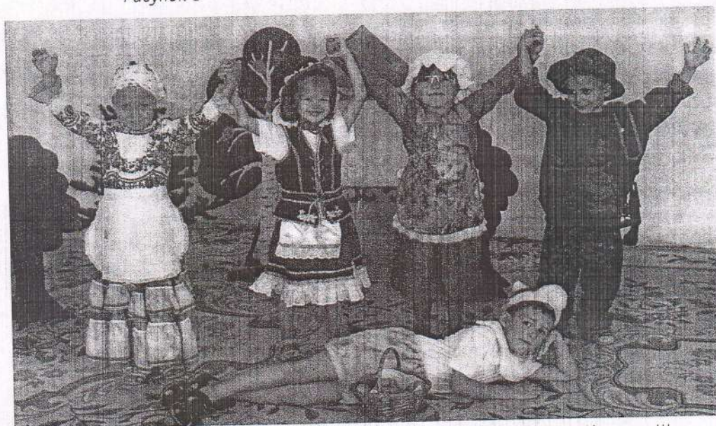
Рисунок 1–3 – Театрализованное представление по мотивам сказки «Красная Шапочка»