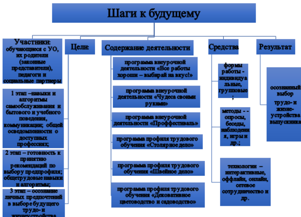
Рис. 1. Модель «Шаги в будущее» по профориентации обучающихся с умственной отсталостью ГБОУ школа 59 г. Краснодара.

В течение 2017-2019 учебных лет в школе была реализована программа внеурочной деятельности для обучающихся с умственной отсталостью 5-10 классов: «Чудеса своими руками», а в летний период были проведены профориентационные мероприятия для обучающихся 5-9 классов по теме «Профестиваль «Мир в радуге профессий».