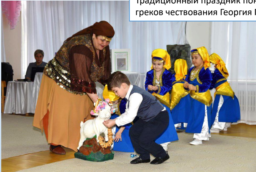
Традиционный праздник понтийских греков чествования Георгия Победоносца