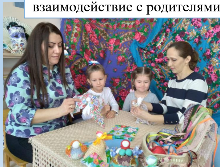
взаимодействие с родителями