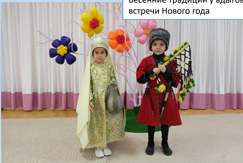
Весенние традиции у адыгов-шапсугов встречи Нового года