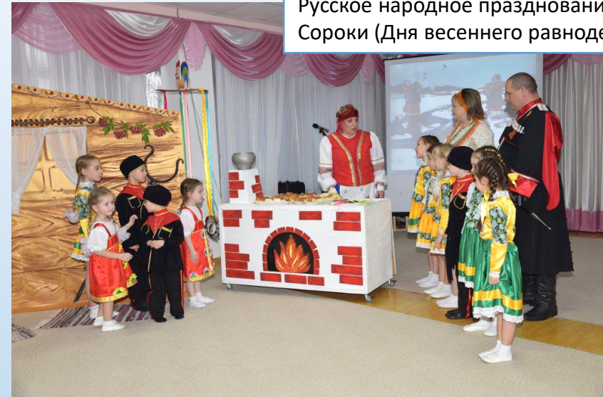
Русское народное празднование дня Сороки (Дня весеннего равноденствия)