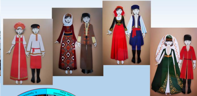
Демонстрационные материалы к экспозиции «Народные костюмы народов Причерноморья Кубани»