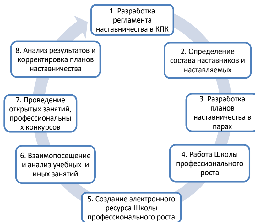
Рис. 1 – Алгоритм корпоративного наставничества в ГБПОУ КК «Краснодарский педагогический колледж»

- вхождение наставляемого в трудовой коллектив колледжа, освоение им корпоративной культуры и традиций организации.