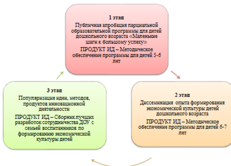
Рисунок 2 – Этапы реализации инновационной программы

В третьих, разработка и тиражирование методического обеспечения по формированию основ экономической культуры детей дошкольного возраста, а так же популяризация идеи, методов и продуктов инновационной деятельности по теме программы.