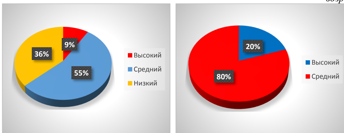
Рисунок 1. Сравнительная диагностика уровня развития речи детей младшего дошкольного возраста.