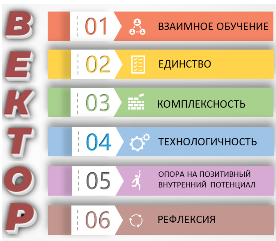
Рисунок 4. Модель системы принципов "ВЕКТОР"

Основными принципами модели «ВЕКТОР» являются: