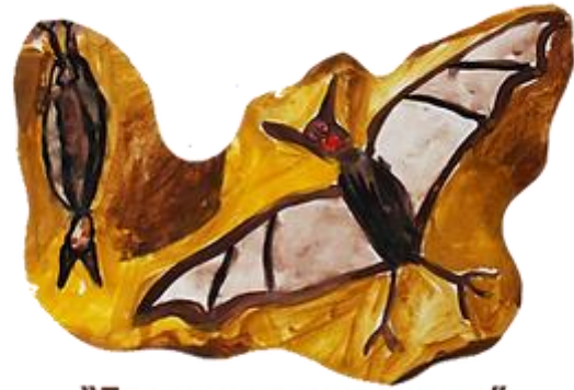
“Где живут животные”

БУККРОССИНГ (англ. bookcrossing) - в буквальном переводе с английского значит "перемещение книг" или книговорот. Это хаотичный обмен книгами. Его идея довольно проста – «Прочитал книгу сам – передай другому». Главная цель - пропаганда чтения, повышение интереса к чтению книг у родителей и детей, обогащение духовного и культурного уровня дошкольников, возрождение традиции семейного чтения.