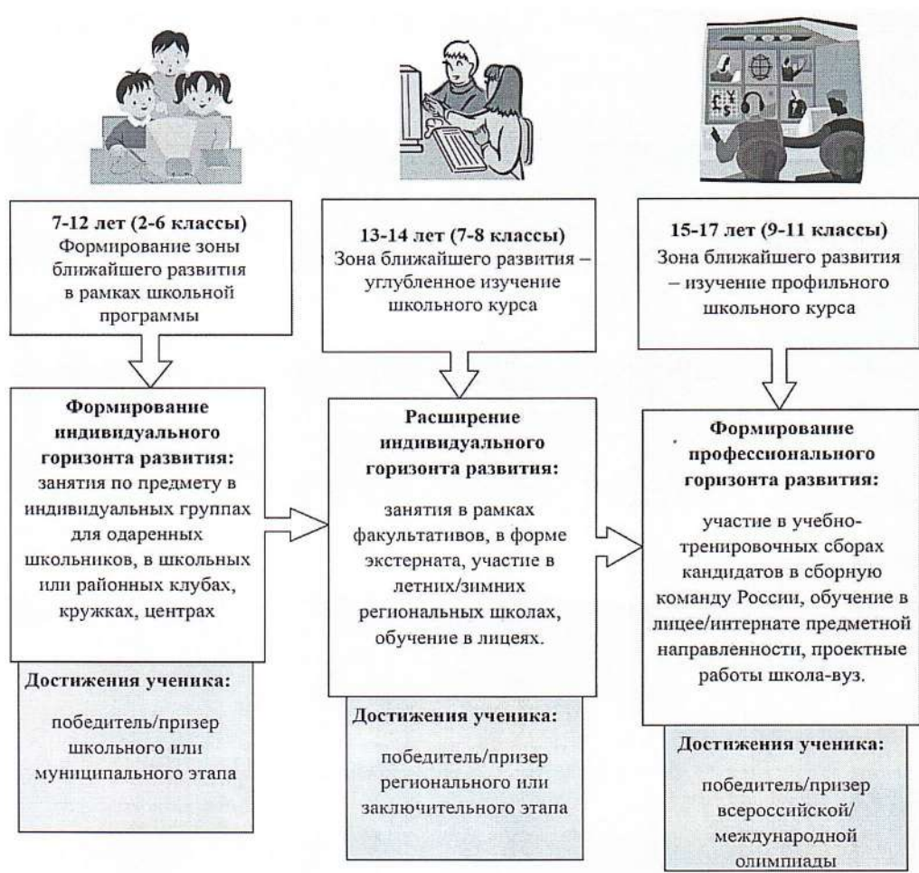
Рис. 2. Модель опережающего обучения «Горизонт развития»