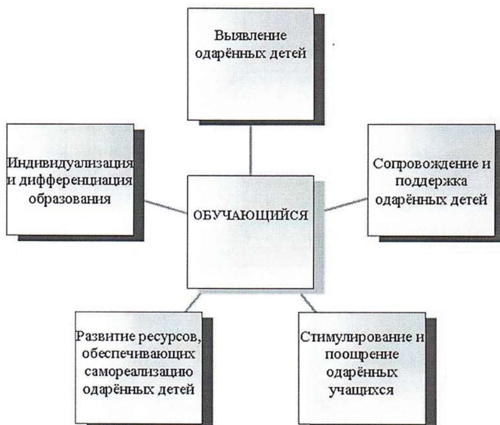
Рис. 1 Модель выявления одаренных детей