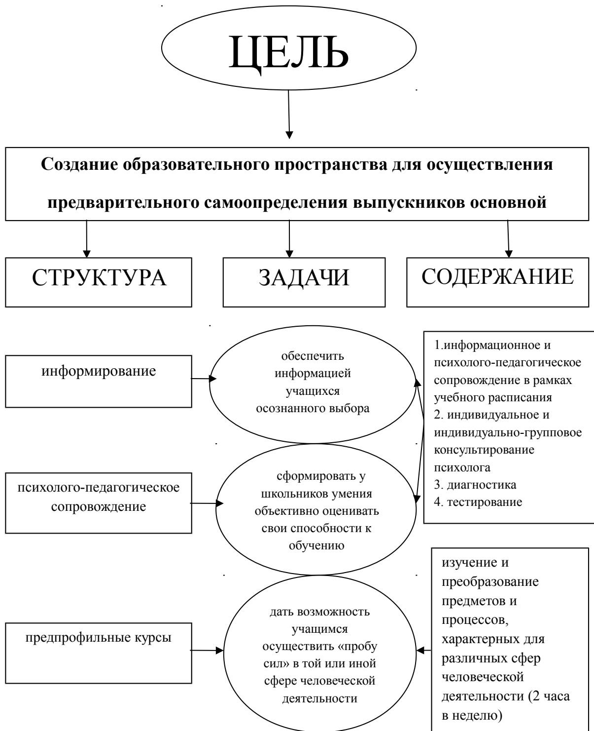
Рис.1. Базовая модель предпрофильной подготовки