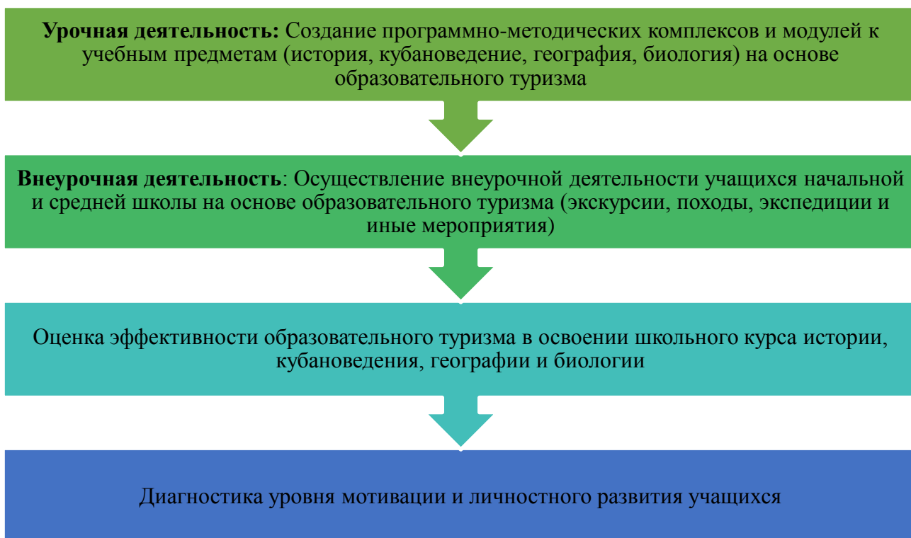
Рис. 2. Процесс интеграции педагогически организованного образовательного туризма в учебный процесс начальной и средней школы

2) Создание на базе Центра внешкольной работы Молодежного экскурсионного агентства «Я люблю Сочи»