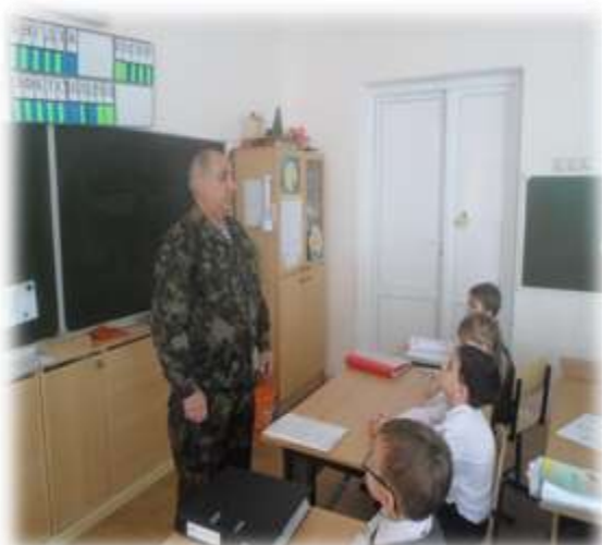
Встреча с «афганцами»