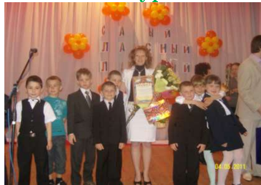
САМЫЙ КЛАССНЫЙ 2011