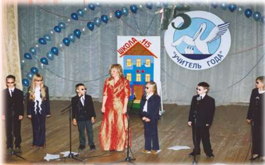
УЧИТЕЛЬ ГОДА - 2005