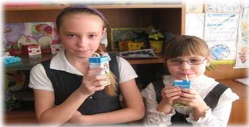
Каждый день пьем молоко