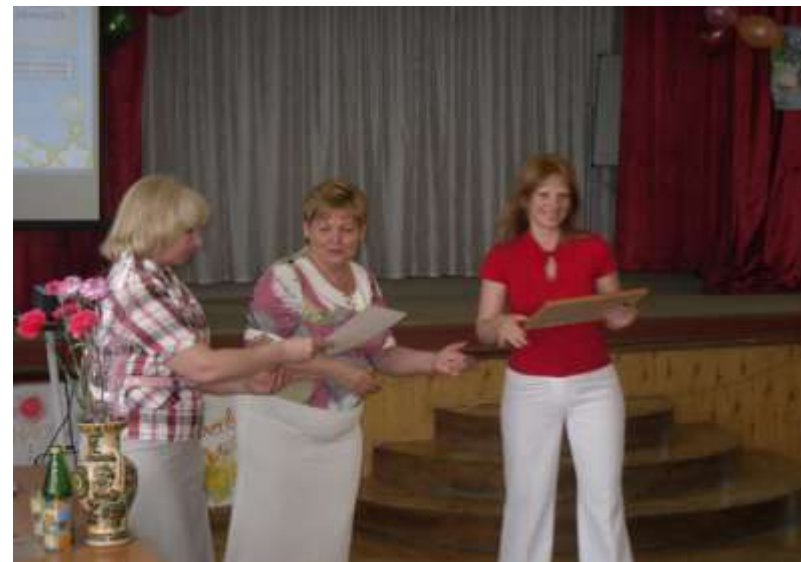
победитель муниципальных конкурсов