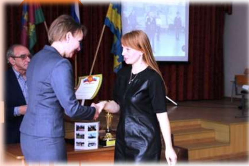
Победитель месячника обороны