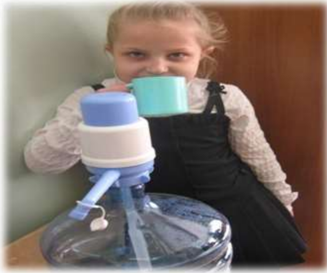
Мы пьем чистую воду