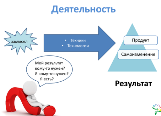
Схема 1. Деятельность

Специфика юношеского возраста связана с базовым возрастным процессом – поиском идентичности (Э.Эриксон) на мировоззренческом уровне. Таким образом, ведущей деятельностью данного периода жизни человека является самоопределение (П.Щедровицкий, А.Попов, С.Ермаков) как практика становления, связанная с конструированием возможных образов будущего, проектированием и планированием в нём своего индивидуального пути. Процессы самоопределения реализуются через осуществление набора проб (Б.Эльконин) и приобретение опыта подготовки к принятию решений о мере, содержании и способе своего участия в образовательных и социальных практиках, которые могут выражаться в разных формах через технологическую организацию жизнедеятельности.