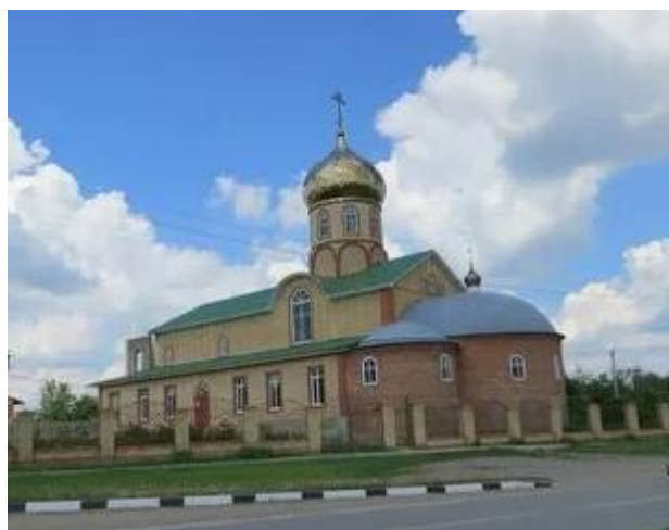
Церковь Николая Чудотворца (бывший Народный дом)