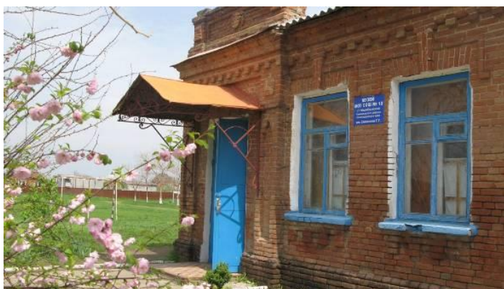
Здание школьного музея имени Г.Г. Степанова