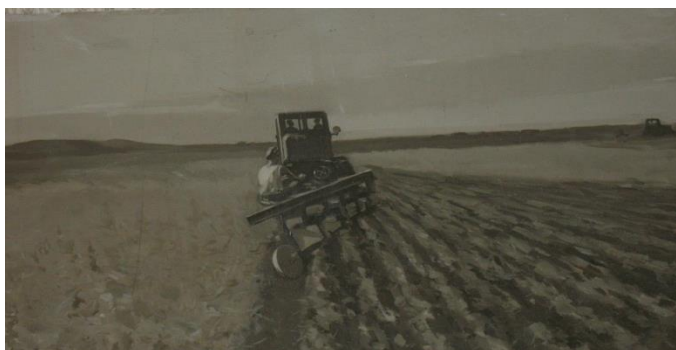
Стены здания украшены фресками.