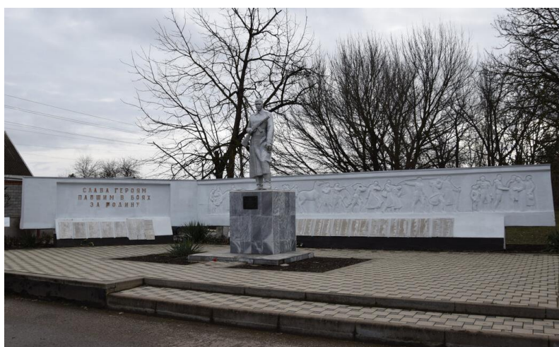
Памятник, погибшим бойцам в годы Великой Отечественной войны (17 мраморных плит с 446 фамилиями погибших и 4 плиты с 37 фамилиями пропавших без вести) (установлен в 1965 г.)