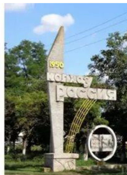
Мемориальная доска на здании правления колхоза «Россия». памятная стела перед мостом через р. Кирпили «Колхоз «Россия» 1950 г. (автор Губский Н.Н.)