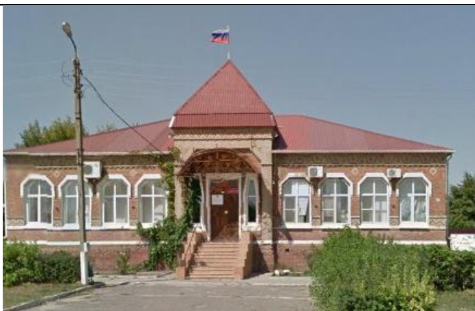
Здание администрации медведовского сельского поселения (женская школа для девочек из казачьих семей, начало строительства 1898 г.)