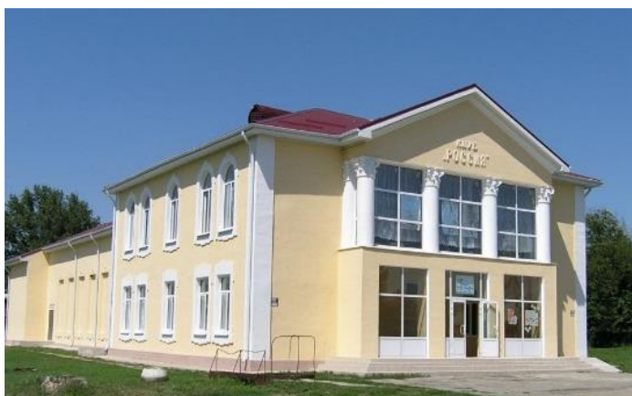
Здание СДК «Родина», построено в 1957 г.