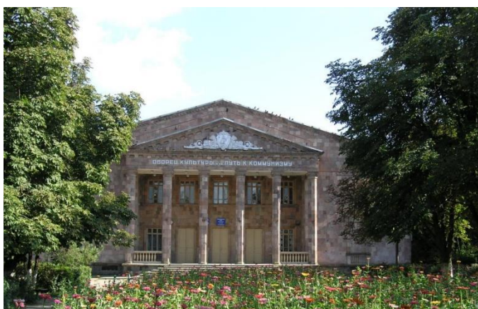
Здание колхоза «Путь к коммунизму» (построено в 1963 г.)