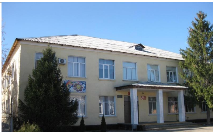
Здание МБОУ СОШ № 10, построено в 1964 г.