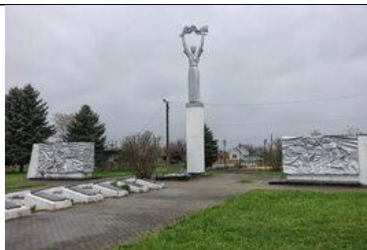
Памятный мемориал, в честь 45-летия Победы в годы Великой Отечественной войны