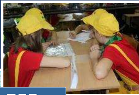
«Слёт знатоков ПДД»