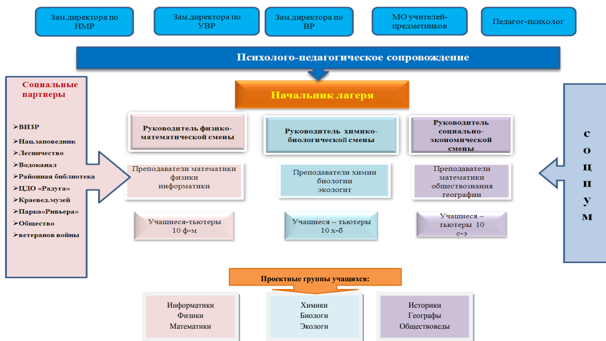
Схема управления профильным лагерем