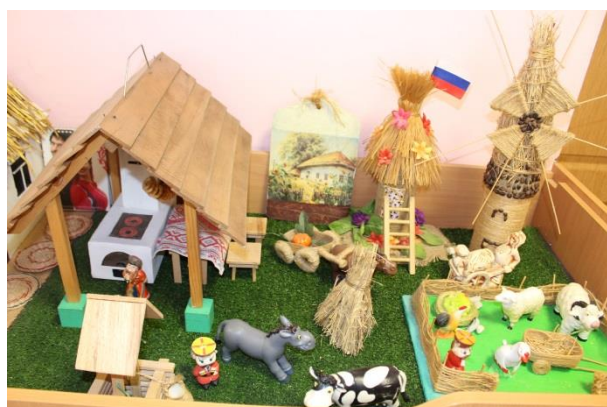
Рис. 1 Игровая экспозиция. Мини-музей «Казачья хата», «Кубанское подворье».