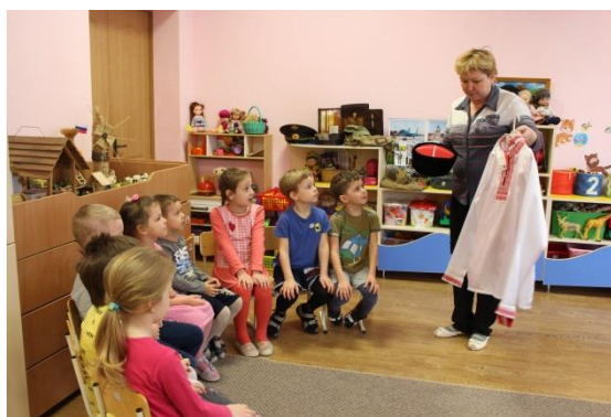
Рис.6 Элементы национальных костюмов народов Северного Кавказа

3) педагогическими работниками разработаны 8 социальных проектов, которые реализованы в рамках поликультурного взаимодействия. В данные проекты вовлечено более 1000 человек, в их числе – дети дошкольного возраста, посещающие и не посещающие детский сад, а также родители (законные представители), социальные партнеры, представители общественности.