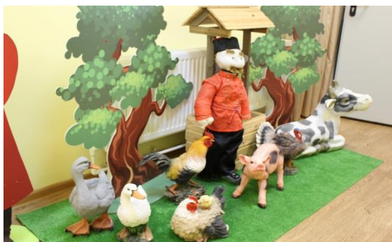
Рис. 5 Домашние животные, Северного Кавказа

Рис.3,4 Предметы игровой предметно-пространственной среды. Кукла в национальном костюме. Предметы быта народов Северного Кавказа