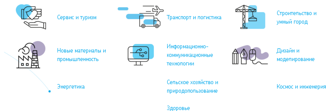
Схема 2. Сферы деятельности, представленные в проекте «Билет в будущее».

Профорентационная работа в каждом образовательном учреждении имеет свою систему реализации . Что сегодня имеем мы?