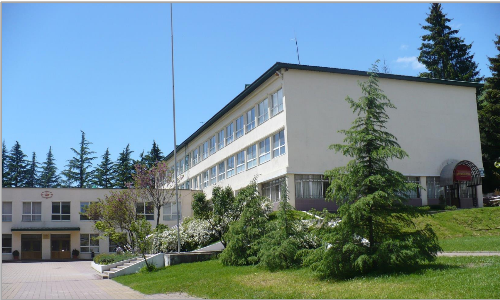
МУНИЦИПАЛЬНОЕ ОБЩЕОБРАЗОВАТЕЛЬНОЕ БЮДЖЕТНОЕ УЧРЕЖДЕНИЕ СРЕДНЯЯ ОБЩЕОБРАЗОВАТЕЛЬНАЯ ШКОЛА №65