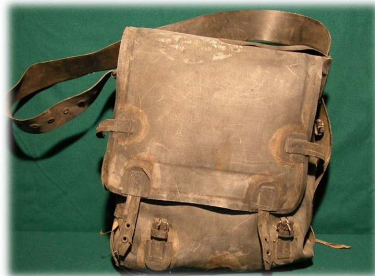
Полевая сумка офицера