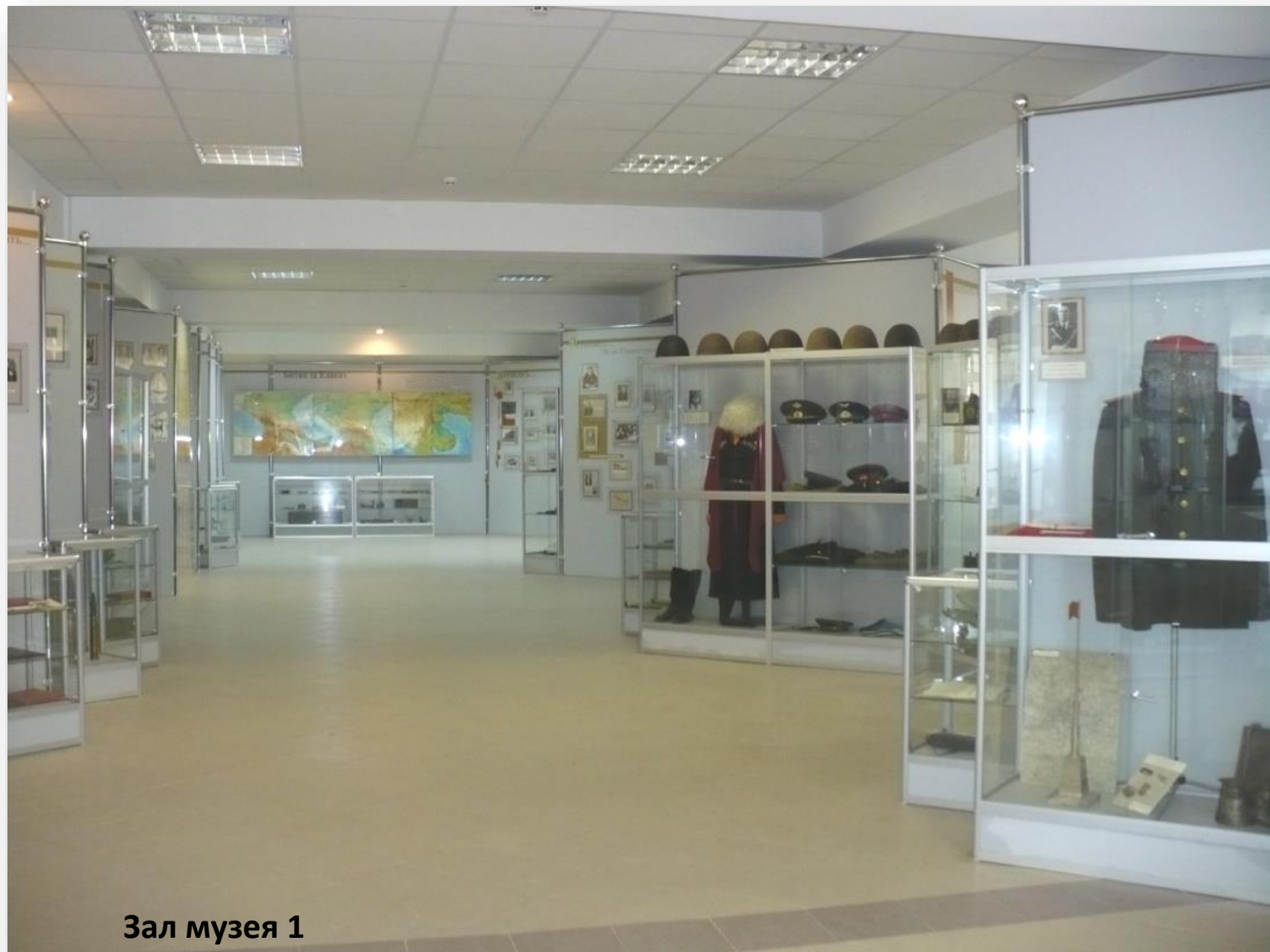
Зал музея 1