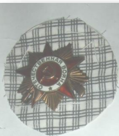
Это орден «Отечественной войны I степени»