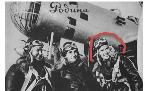
Герой Советского Союза Марина Раскова -инициатор формирования женских авиационных полков