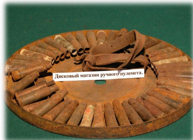
Дисковый магазин ручного пулемета.