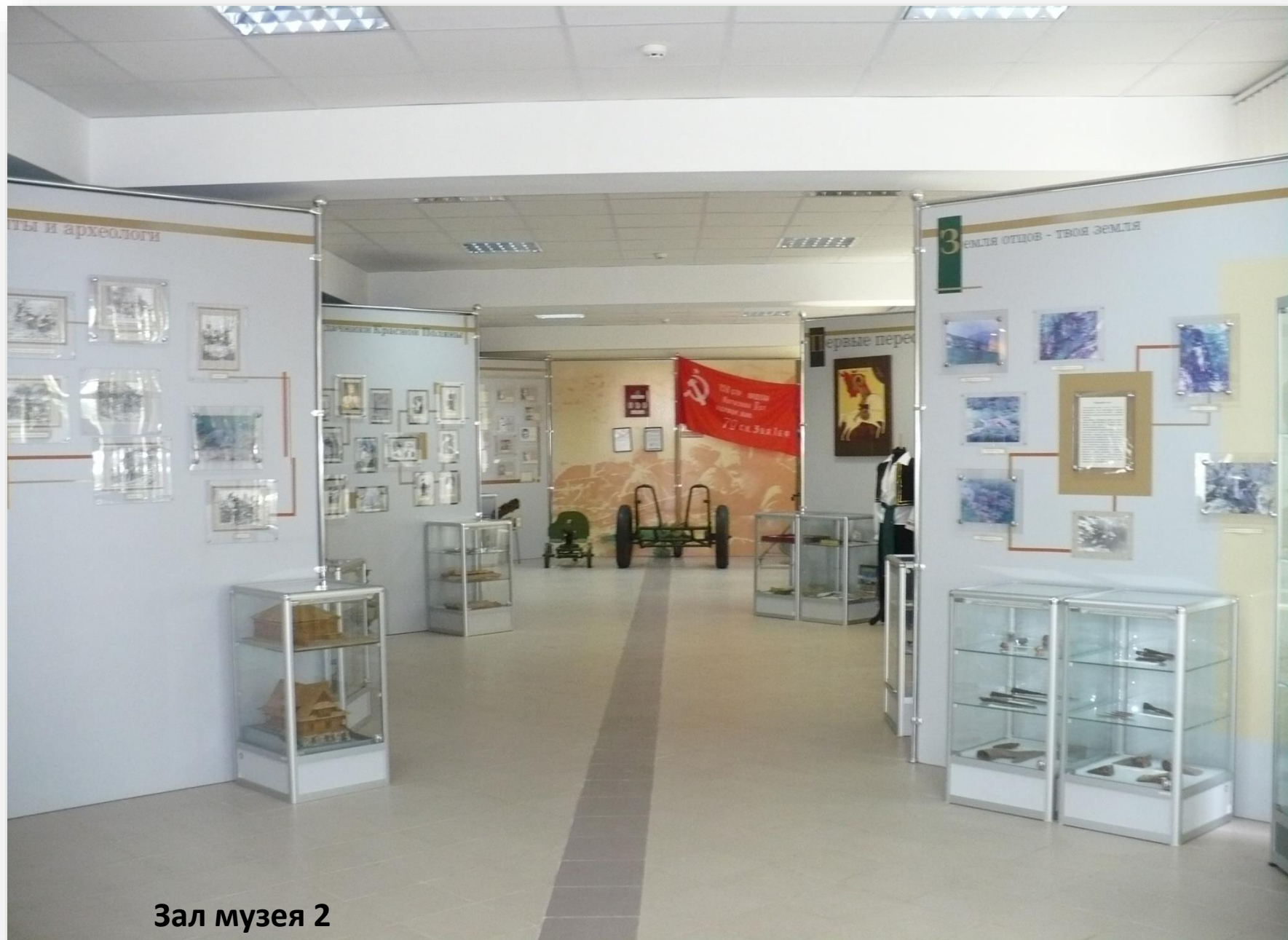
Зал музея 2