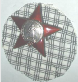
Это орден «Дружбы Народов»