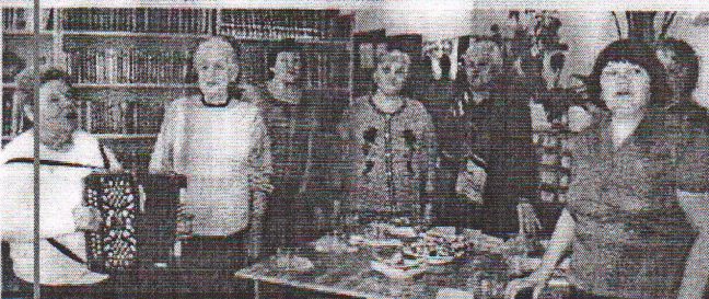
Коллектив «Играй, гармонь!» поет о родной земле