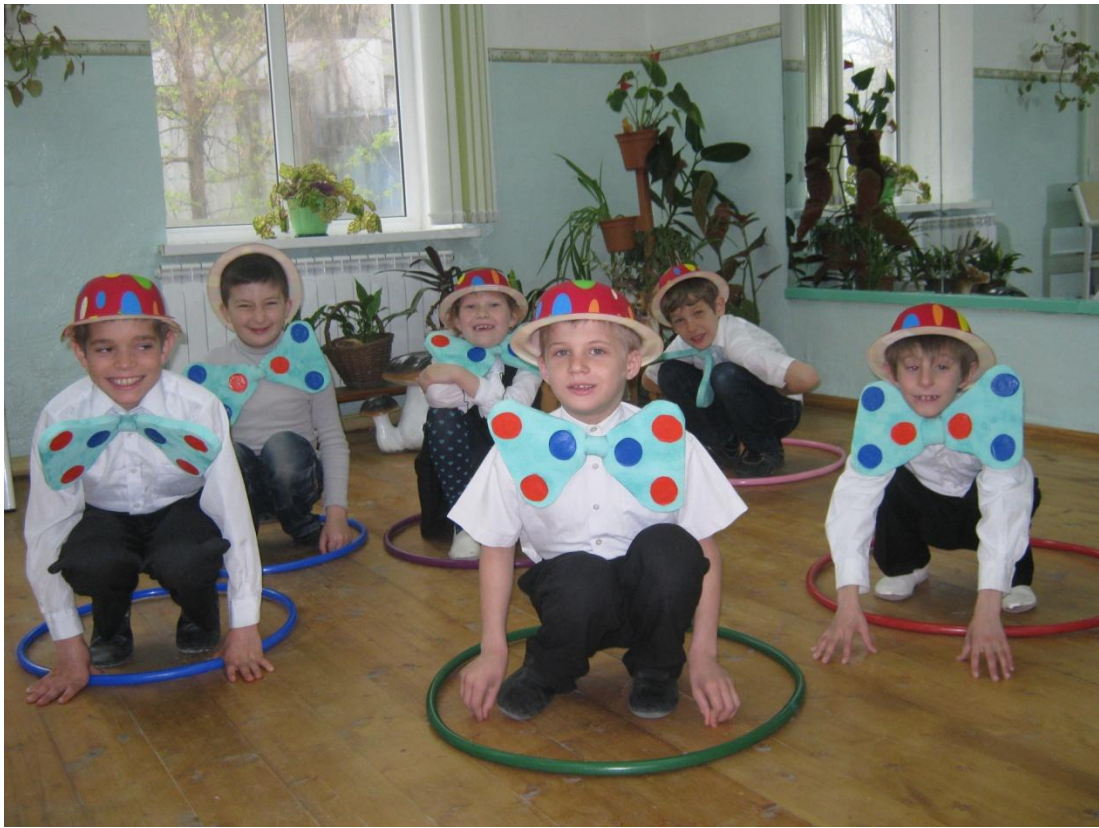
Комплект костюмов «Веселый клоун»