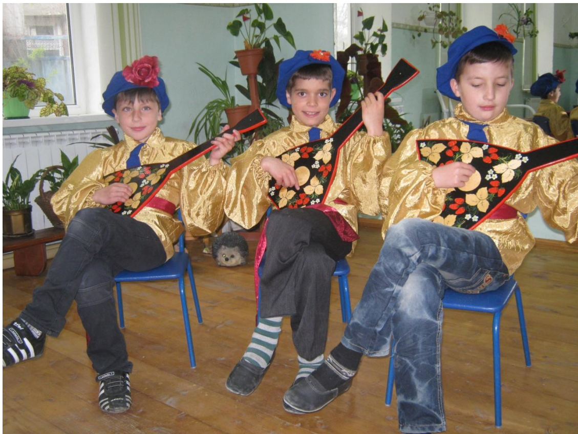
Комплект русских народных костюмов