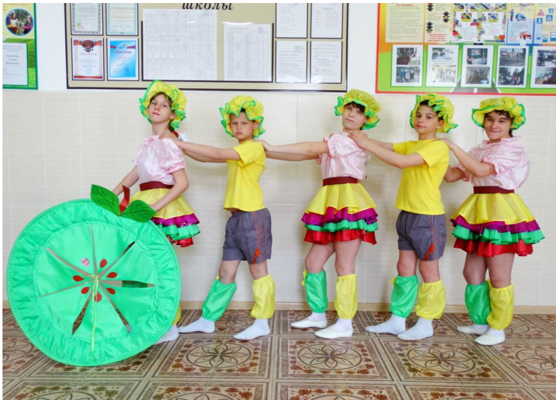
Комплект костюмов для танца «Веселая гусеница»