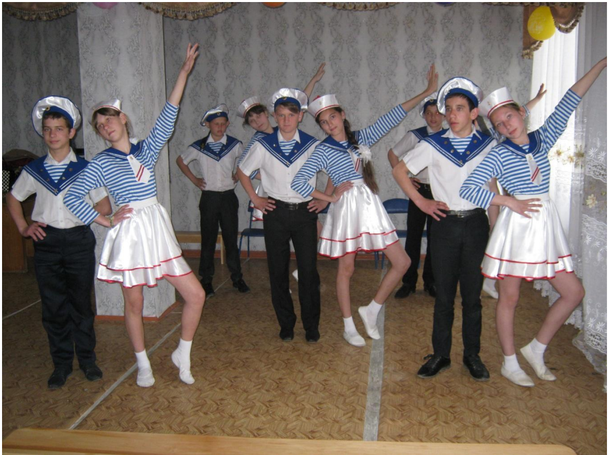
Выступление в социально-реабилитационном центре «НИКА»