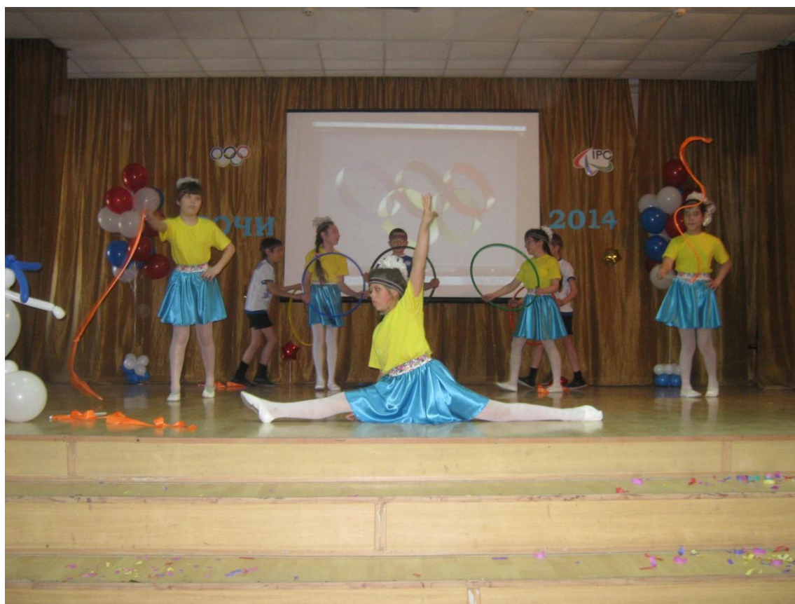
Выступление на краевом фестивале