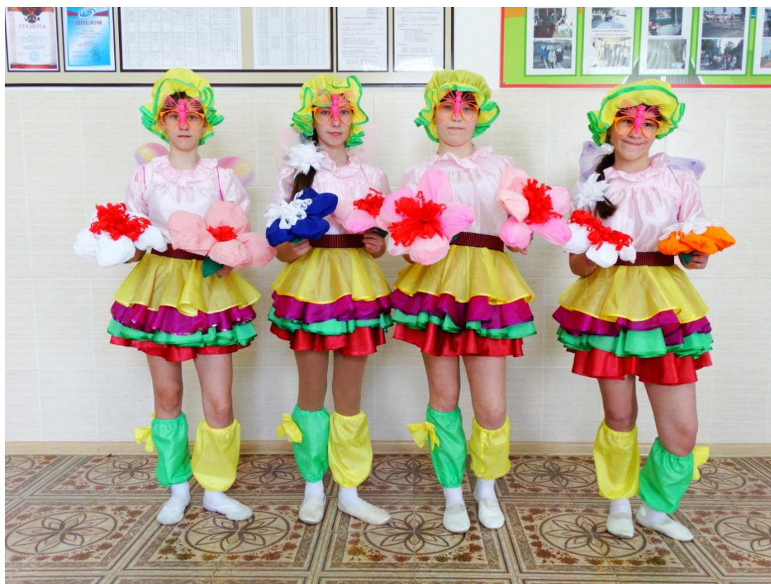
Комплект костюмов бабочек