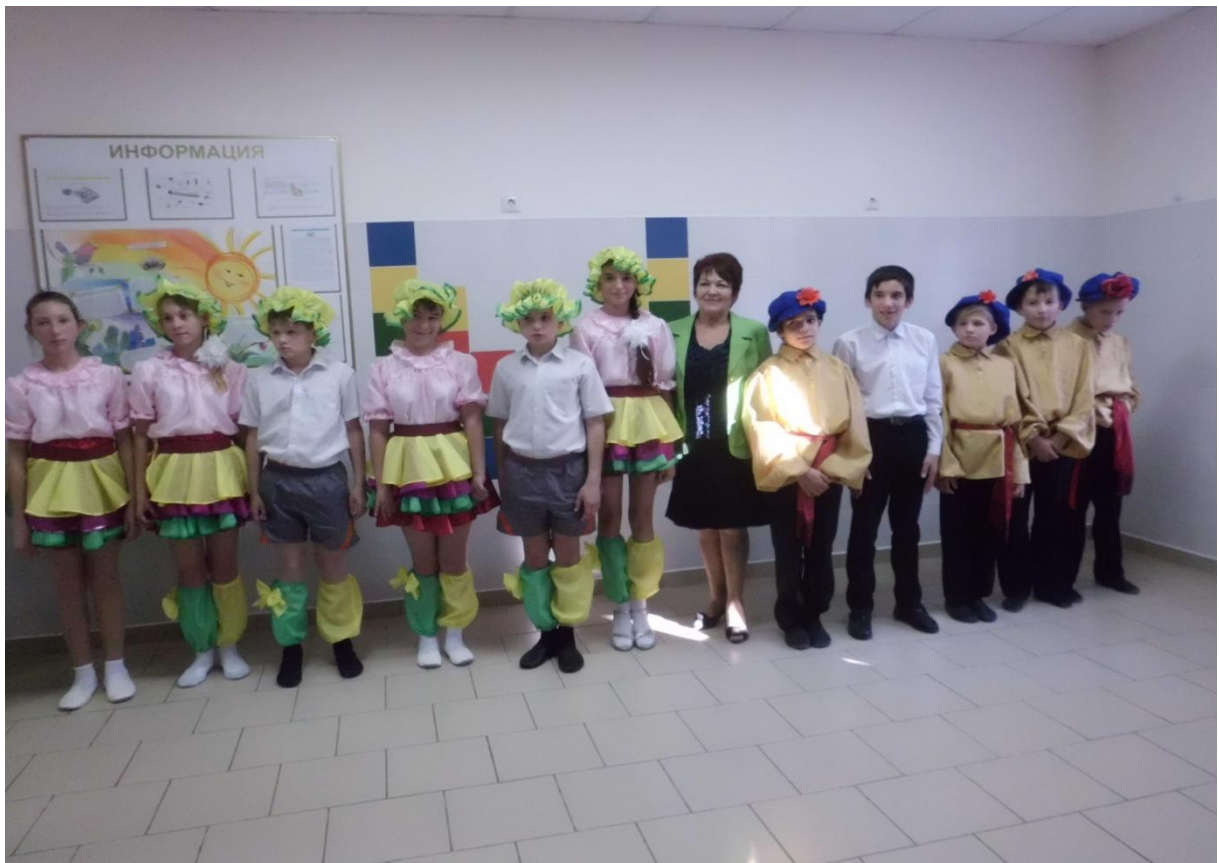
Выступление в соматическом отделении МУЗ «Детская городская больница»