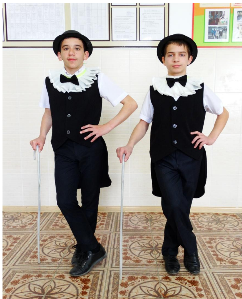
Комплект костюмов для чарльстона