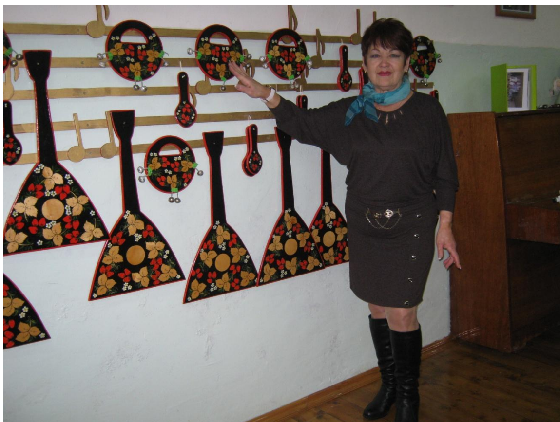
Изготовление шумовых инструментов