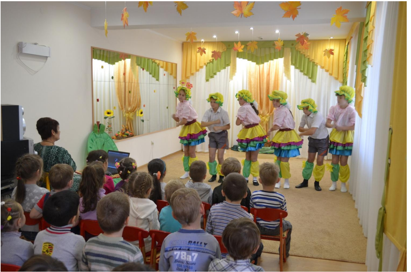
Выступление в специализированном детском саду «Пчелка»