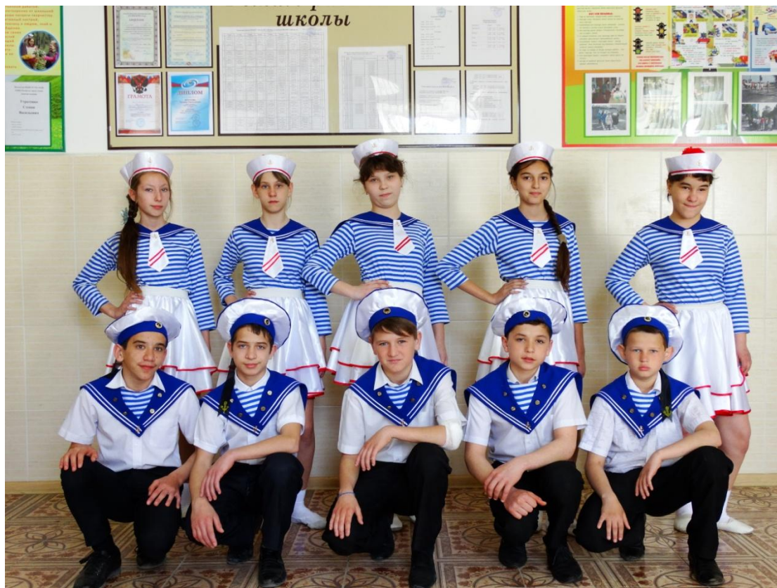
Комплект морских костюмов