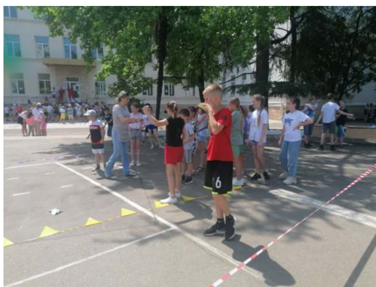
Фото 10. Площадка «Мне бы в небо..», МОБУ СОШ № 7. Запуск модели планеров.