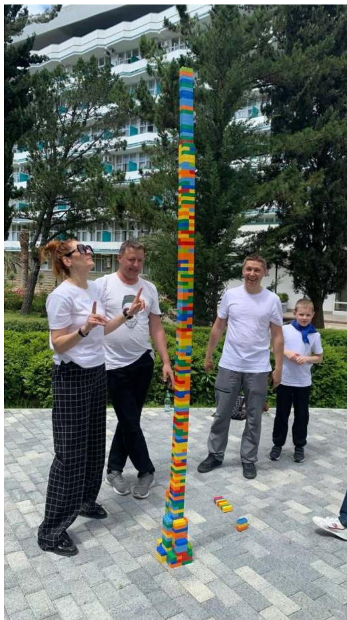
Фото 3. Площадка «Самая высокая башня», Санаторий «Знание».

Материально-техническое обеспечение: конструктор Лего, таймер, рулетка (большая линейка), 2 стола.