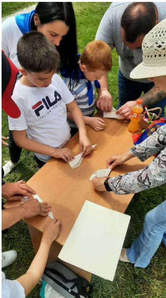
Фото 9. Площадка «Мне бы в небо...», Санаторий «Знание». Родители и дети изготавливают модели планеров.

использовать инструкцию). Разметка боковых границ площадки запуска (флажки, лента и т.п.), рулетка.