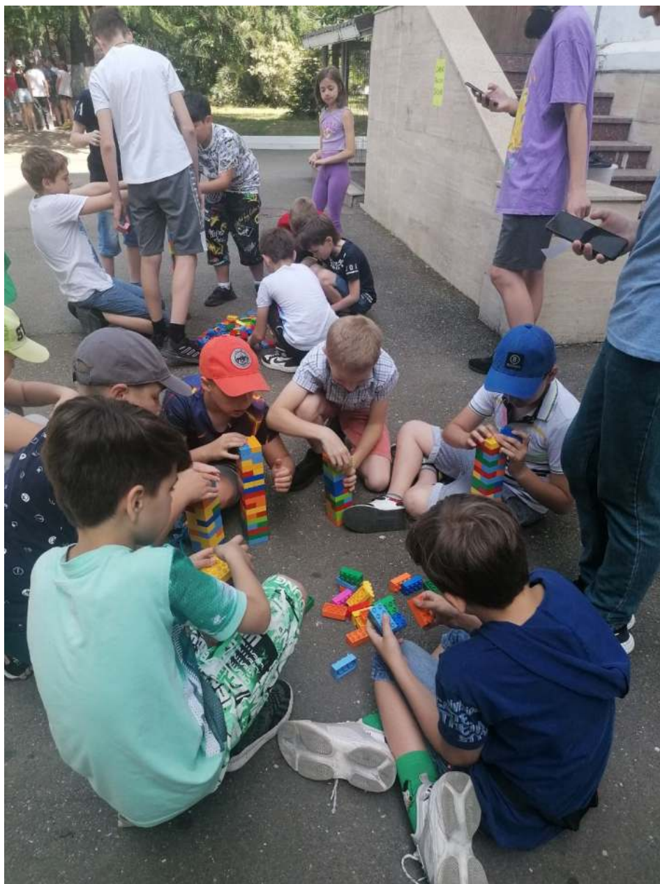
Фото 4. Площадка «Самая высокая башня», МОБУ СОШ № 7.