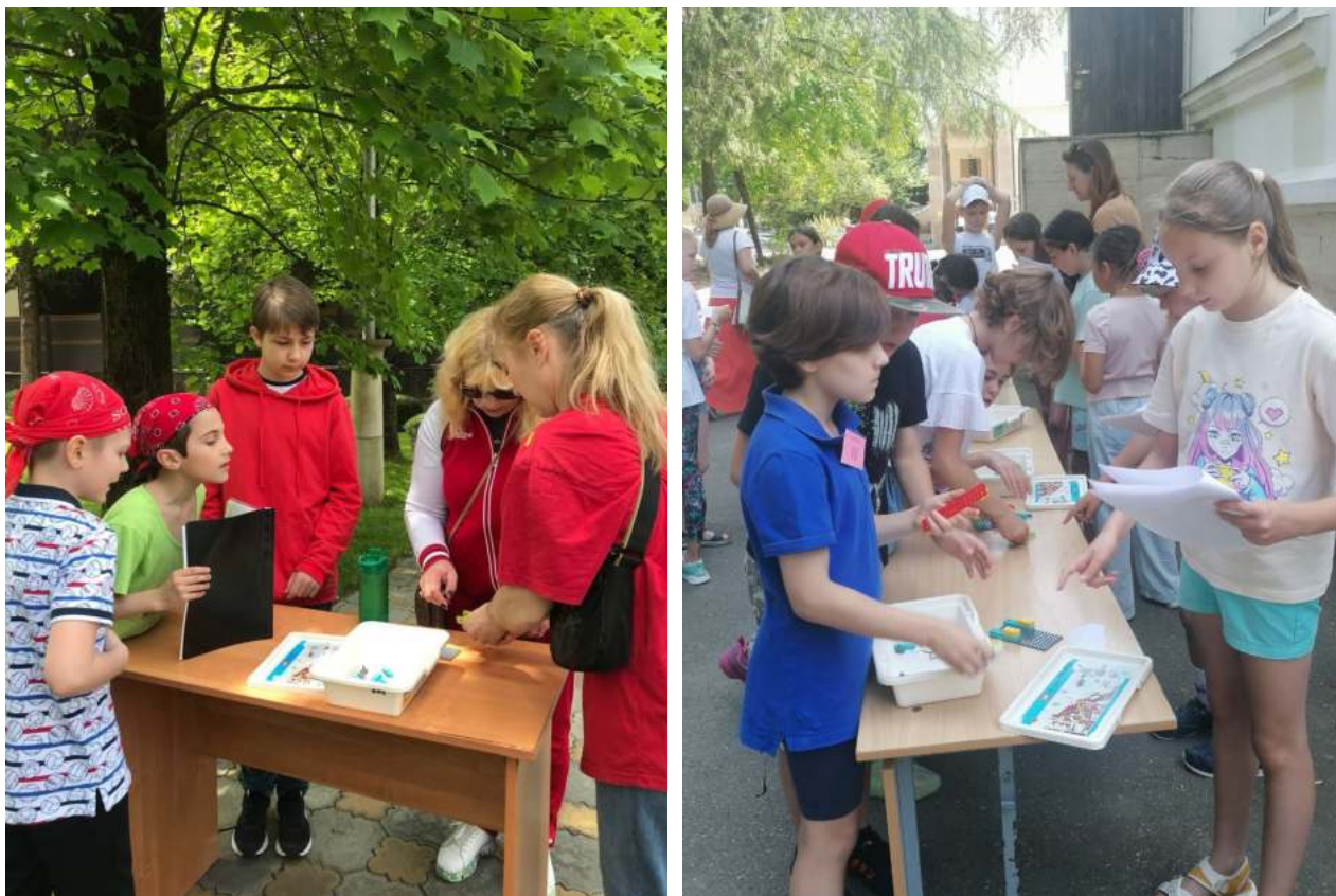
Фото 5, 6. Площадка «Объяснялки»: Санаторий «Знание» и МОБУ СОШ № 7.

Материально-техническое обеспечение: 2 комплекта конструкторов, 2 инструкции, 3 стола.