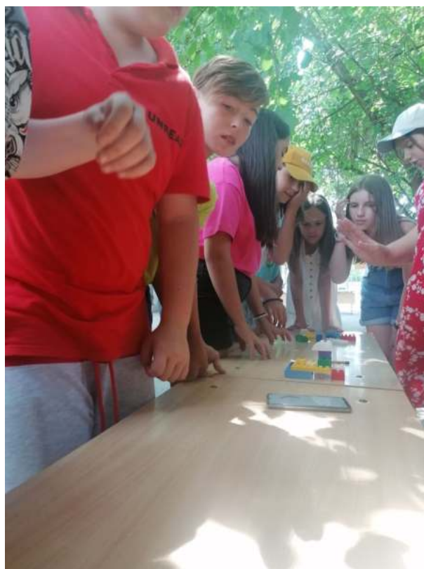
Фото 11, 12. Площадка «Шерлок Холмс»: Санаторий «Знание», МОБУ СОШ № 7.