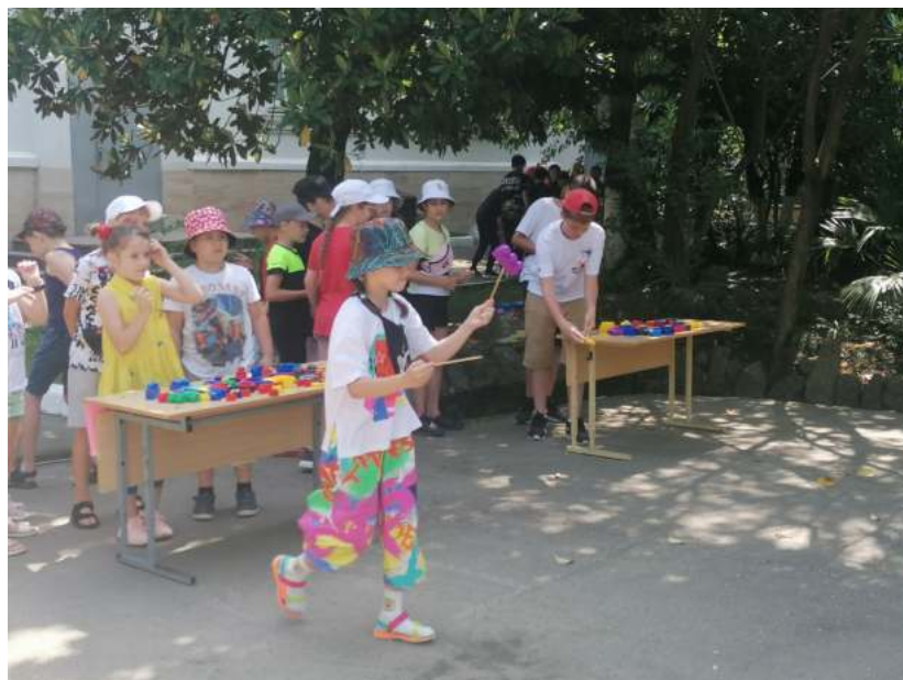
Фото 2. Площадка «Суши-бега», МОБУ СОШ № 7.