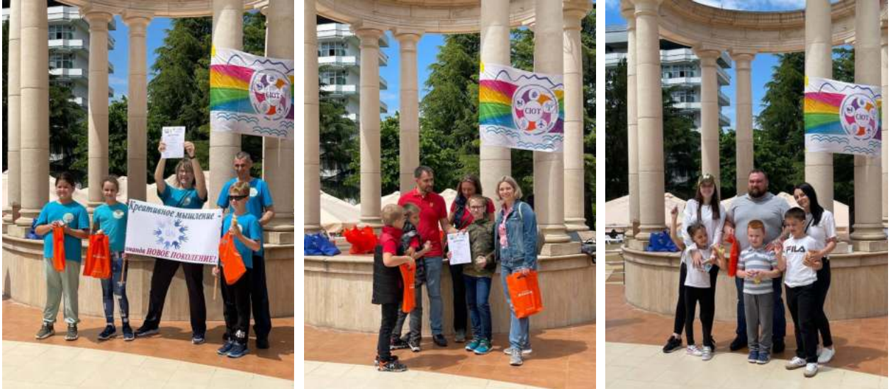
Фото 19, 20 и 21. Вручение дипломов победителям. Санаторий «Знание»