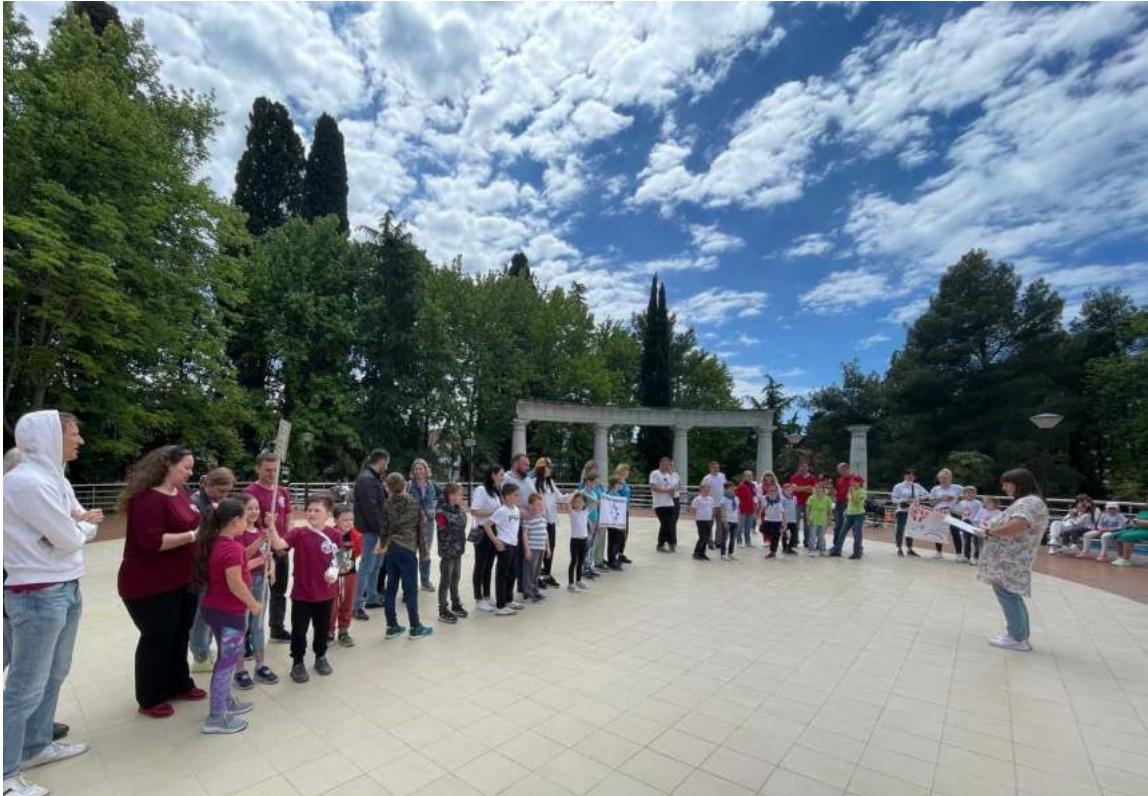
Фото 17. Открытие семейного фестиваля в санатории «Знание» .

В перерывах между соревнованиями и в свободную минутку отдыха можно было насладиться выступлением и дальнейшим общением с аниматорами в костюмах роботов-трансформеров (см. фото 18). Прекрасное праздничное настроение было создано как гостям, так и участникам праздника.