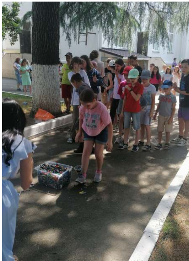
Фото 13, 14. Площадка «Лего-забег»: Санаторий «Знание», МОБУ СОШ № 7.