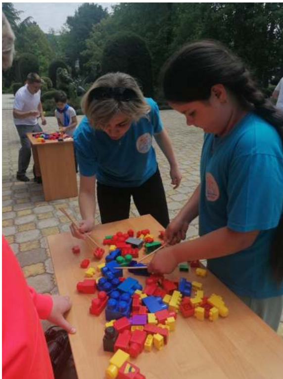
Фото 1. Площадка «Суши-бега», Санаторий «Знание».

Материально-техническое обеспечение: суши-палочки, два набора конструкторов, таймер, 2 стола.