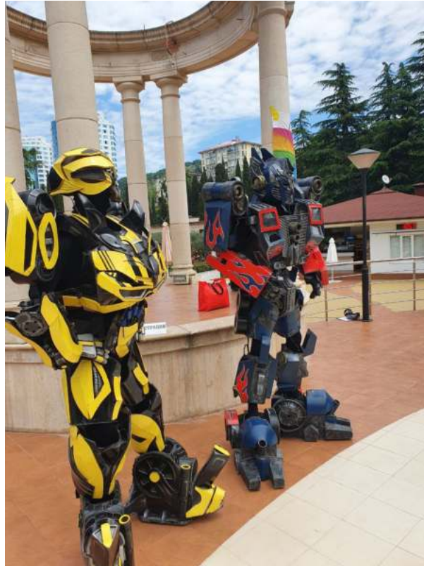
Фото 18. Аниматоры санатория «Знание».