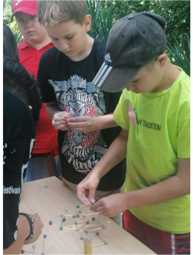
Фото 15, 16. Площадка «Пластилиновый конструктор»: Санаторий «Знание», МОБУ СОШ № 7.