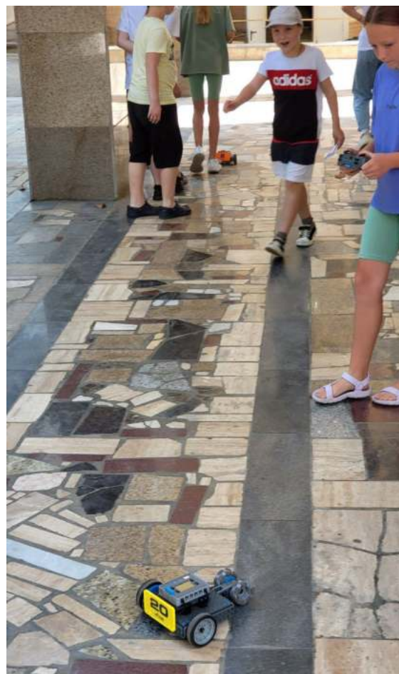
Фото 7, 8. Площадка «Автогонки»: Санаторий «Знание», МОБУ СОШ № 7.