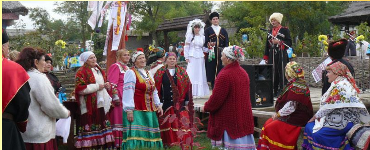
«Обрядовая свадьба» 7.09.13, Тамань