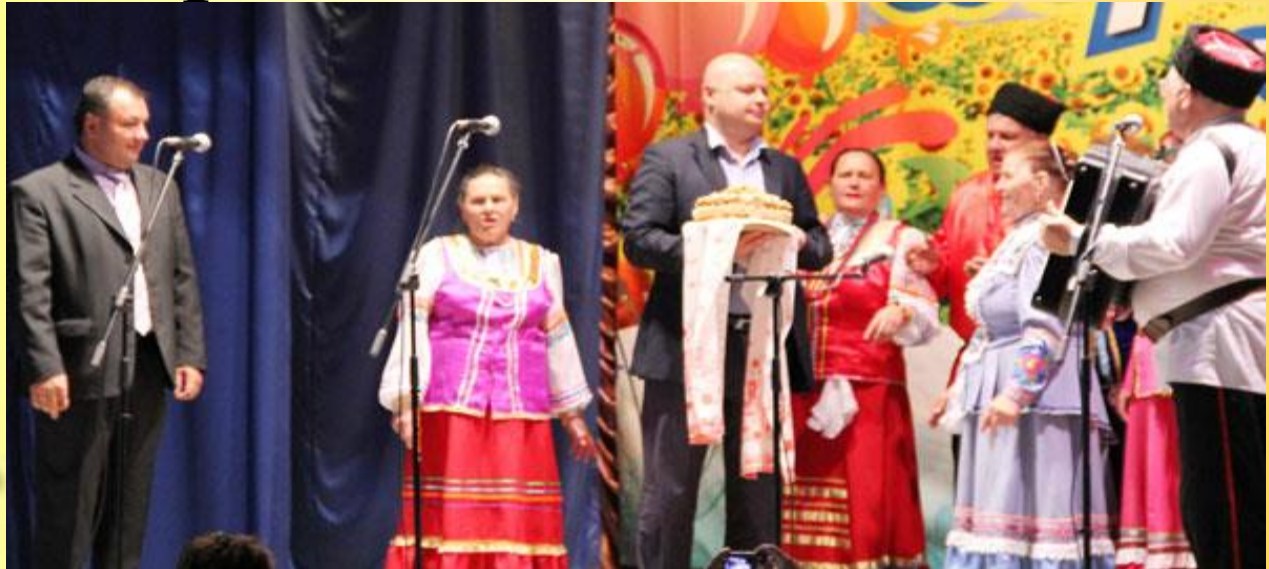
«Обрядовая свадьба» 21.09.2013, Тверская