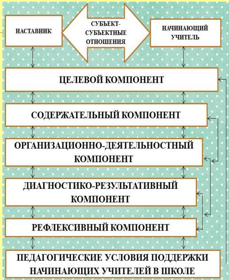
Авторская модель педагогической поддержки начинающего учителя